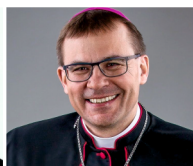
MONS. TOMÁŠ HOLUB